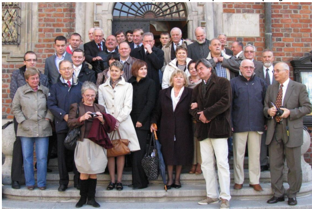
Na schodach Ratusza zbiorowe zdjęcie wszystkich uczestników części oficjalnej.