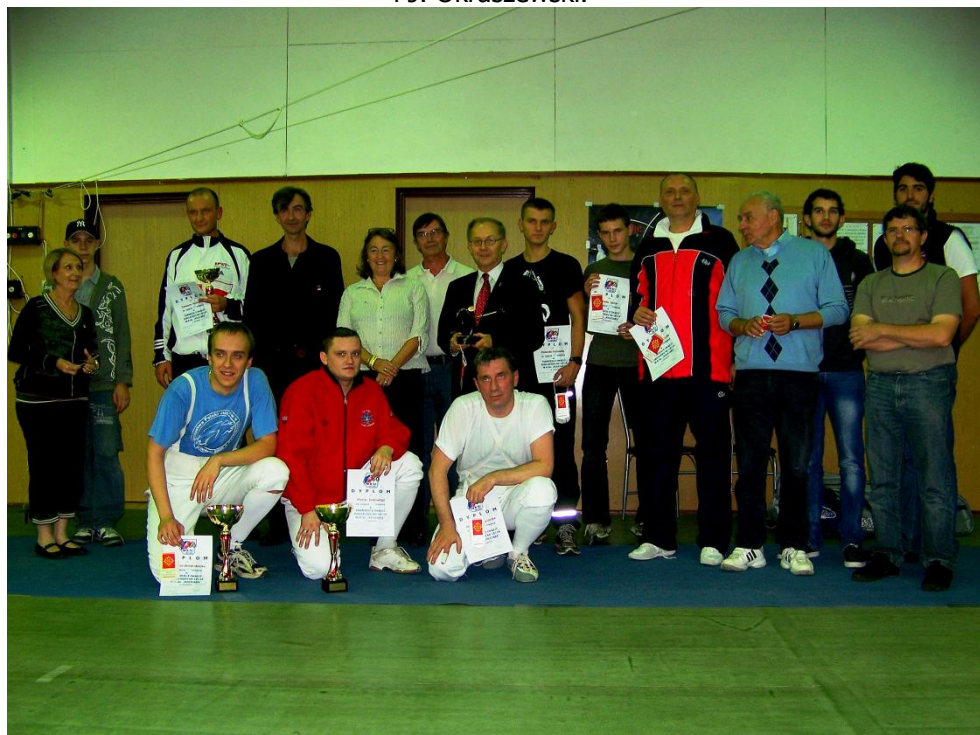
Wspólne zdjęcie ekip: francuskiej i „Kolejarza” po zakończeniu okolicznościowego turnieju w szpadzie.