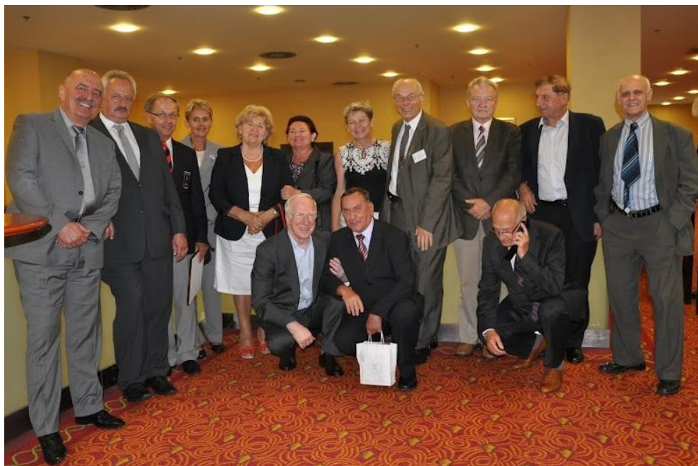
Zbiorowe zdjęcie w czasie przerwy w akademii okolicznościowej.