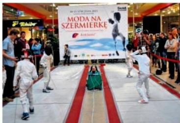
► Mali zawodowcy swoją postawą zarażali do dyscypliny innych

Głównymi sponsorami imprezy, którzy ufundowali nagrody były firmy: Leon Paul Polska, Nicol-Sport, Allstar-Polska, a także firmy działające w Galerii Dominikańskiej, takie jak KFC sogood, Pizza Hut, Tchibo, Lulu Cafe, Coffee Heaven i inne.