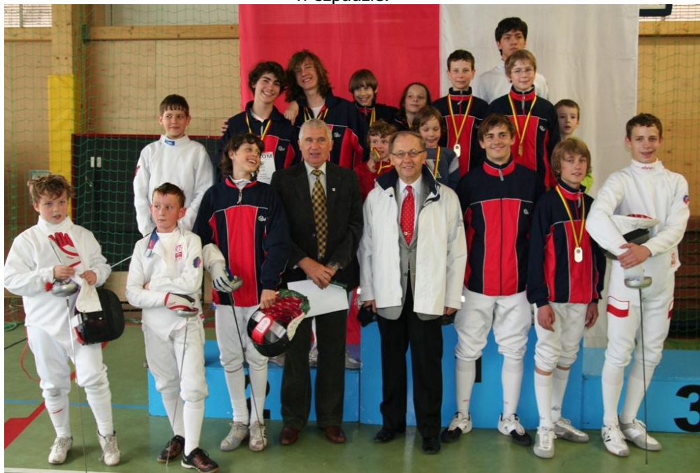
Wrocław, 15.05.2011 r. zbiorowe zdjęcie zadowolonych uczestników I Wrocławskiej Olimpiady Młodzieży.