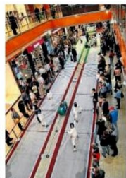
► Impreza rośnie w siłę