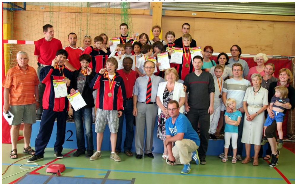
Wrocław, 19 - 20 maj 2012 r. po II Wrocławskiej Olimpiadzie Młodości.